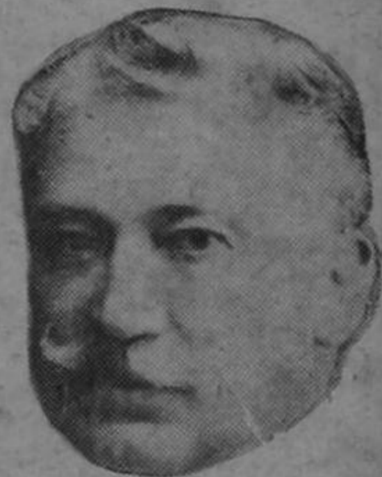
D. JULIO ACOSTA GARCIA, Ex-presidente de la República.

sentido, con este suceso. Para el propio Gobierno, el hecho de no figurar más papeleta que la del partido que está en el poder, hubiera sido poco honroso. Hay victoria, cuando hay lucha y sin la concurrencia libre de los partidos, — expresión fiel de los anhelos populares, — no puede haber elección, menos triunfo, aunque un sólo partido obtenga la totalidad de los vo-